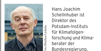
Hans Joachim Schellnhuber ist Direktor des Potsdam-Instituts für Klimafolgenforschung und Klimaberater der Bundesregierung.